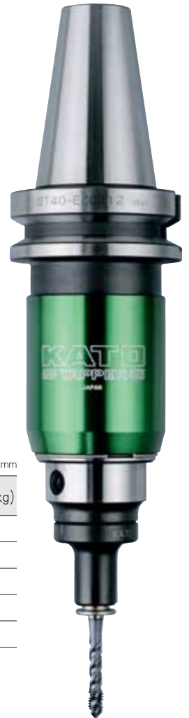
BT40-ECG412 + TCA412-S