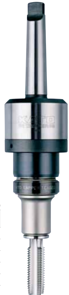
MT3-RA1022 + TC1022