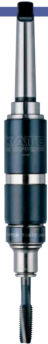
MT2-SA412- I + TC412