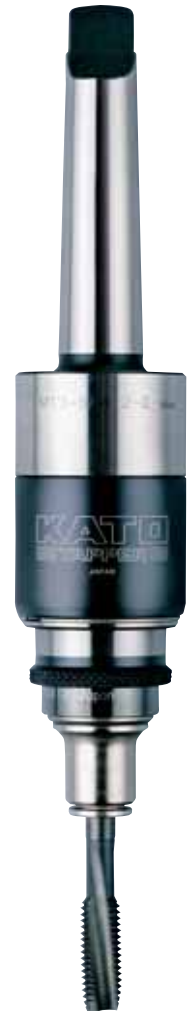
MT3-SA412- II + TC412