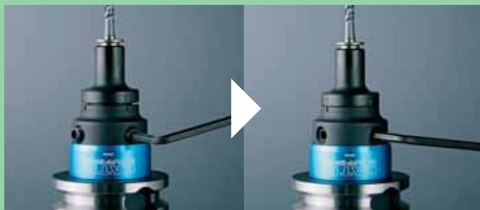
二面拘束によるコレット装着